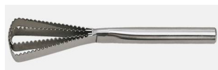
Escamador profesional inox 0790005 560001