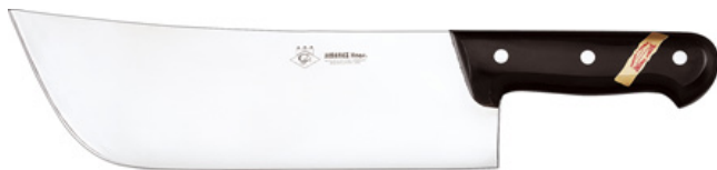
Cortante cordero N. 2 28,5x8,5cm 0832002 552002