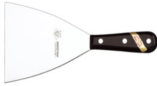
Espátula plancha pom 8cm 1621021