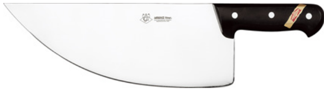
Cuchillo de pescado, pom 28,5cm 0700031 548001