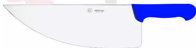
Cuchillo de pescado, mpi azul 32cm 0702004 692002