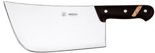
Cortante catalán N.1 22,5cm 0801011 552002