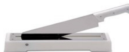
Bacaladera, base fibra blanca 0795010 597002